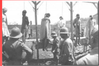
ኢትዮጵያውያን በሐገራቸው ሲሰቀሉ