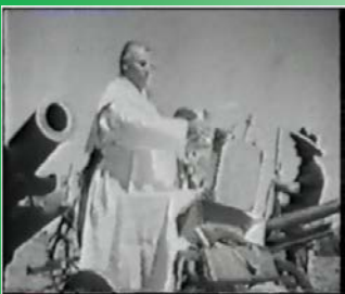
የቫቲካን ካህን ጦር መሣሪያ ሲባርክ