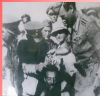
ጣልያኖች ሌ/ጄኔራል ኃይሉ ከበደን አንገት ሲቆርጡ። ወንጀላቸው ለሐገራቸው መዋጋታቸው ነው