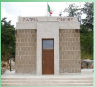
የግራዚያኒ መታሰቢያ በኢጣልያ

የካቲት 12 ቀን 1929 አ/ም በአዲስ አበባ 30,000 ኢትዮጵያውያን በግፍ ተገድለዋል