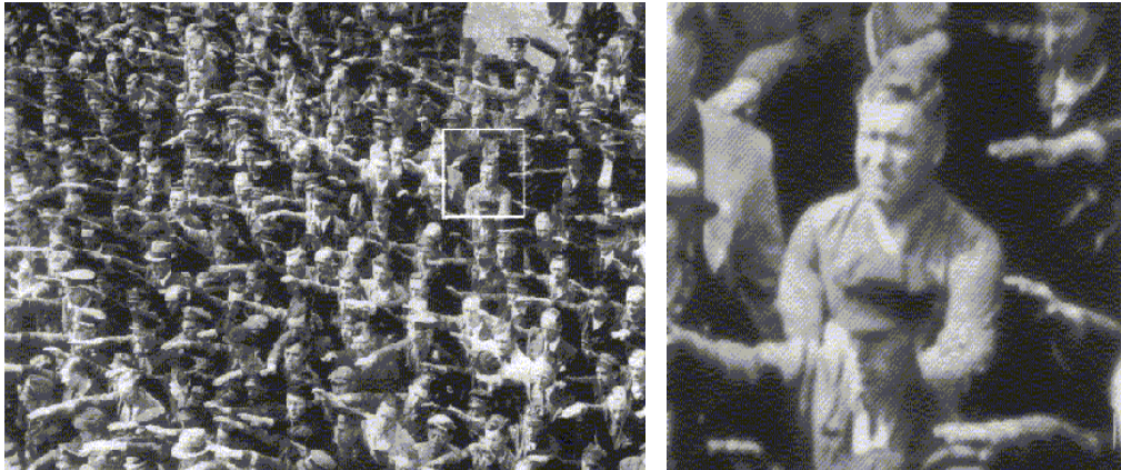
The famous photograph in which August Landmesser refused the Nazi salute. It was in 1936 during the celebrations for the launch of a ship, the 'Horst Wessel'.

ኦገስት ላንድመስር የተባለ ጀርመናዊ ነበር በናዚው ሂትለር ዘመን በ1936 እኤአ በአንድ የመርከብ ምረቃ በዓል ላይ፡ በበዓሉ አብረው የተገኙት በሙሉ፤ የጀርመን ናዚ ሠላምታ ለሂትለር ሲያቀርቡ፤ እሱ ብቻ ነበር የናዚዎችን ሰላምታ ለሂትለር ላለማቅረብ እንቢ በማለት እጆቹን አጣምሮ በፎቶ ላይ የሚታየው።